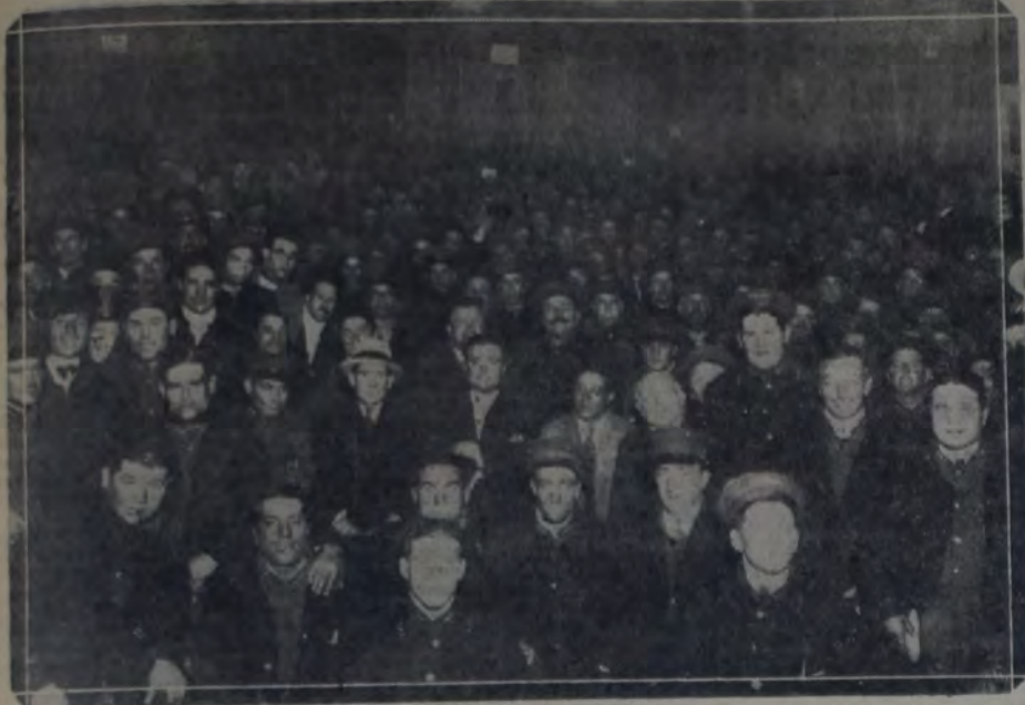
LA CONCURRENCIA A LA ASAMBLEA DE LA UNION TRANVIARIOS

da respecto a las actividades de cierto grupo denominado "clasista", que pretendió introducirse en la Unión Tranviarios, al iniciarse la asamblea se intentó perturbar el desarrollo de la misma, solicitándose la inmediata adopción de medidas de resistencia contra las empresas, para lo cual se