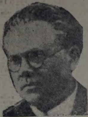
RETRATO DE GLADKOV